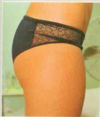
Slečna Lucie před ošetřením

Ošetření bylo velmi příjemné, byl to takový čtyřicetiminutový relax.