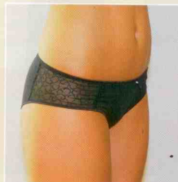
Naše čtenářka po třech aplikacích ztratila 5 cm přes boky a zhubla jí i stehna