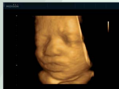
29 weeks fetal face in 3D